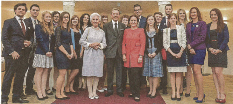
Rund 200 Gäste kamen zur 30-Jahr-Feier der Schinner Vermögenstreuhand und Versicherungsgesellschaft.